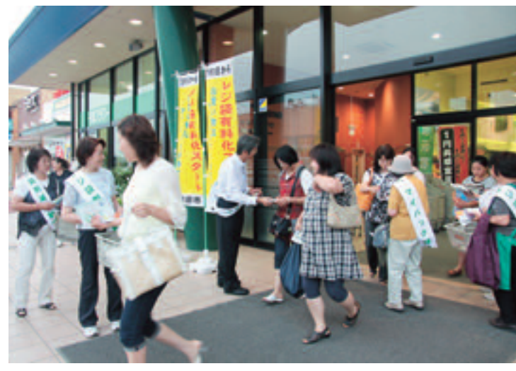
6月27・28日、マイバッグ運動推進店舗で「マイバッグ運動・レジ袋削減運動キャンペーン」を実施して市民へ協力を呼びかけました。

市では、地球温暖化防止、ゴミ減量化のため、市内8店舗の小売店と「銚田市におけるレジ袋削減に向けた取り組みに関する協定」を締結し、7月1日からレジ袋の有料化がスタートしました。市民の皆さんのご理解ご協力をお願いします。