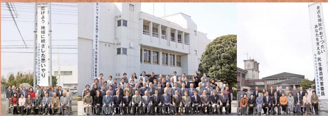
銚田市には、地区担当委員が100名、児童を専門とする主任児童委員7名、合計107名の委員がいます。本年度の活動強化週間の取組みとして、各協議会でスローガンを掲げ、活動を強化しています。

民生委員さんは、児童委員もかねていて、子供や子育て中のお父さん、お母さんに関わる福祉についても担当しているのよ。また、子供に関する問題を専門に担当している主任児童委員さんもいるのよ。