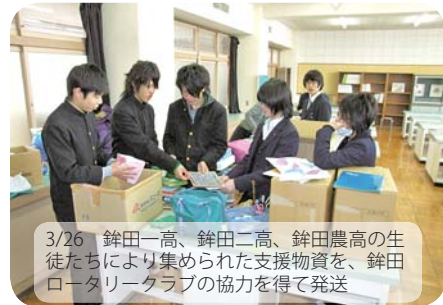
3/26 銚田一高、銚田二高、銚田農高の生徒たちにより集められた支援物資を、銚田ロータリークラブの協力を得て発送