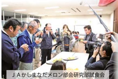
J Aかしまなだメロン部会研究部試食会