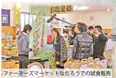
ファーマーズマーケットなだろうでの試食販売