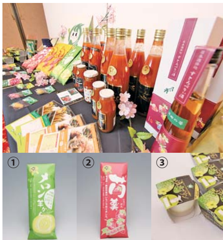
■新規ほこたブランド認証品 ①メロン羊かん(亀印製菓株) ②苺羹(亀印製菓株) ③メロンプリン(茨城乳業株)