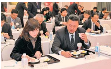
▲総会の中で、試食が行われ、上々の出来との評判でした