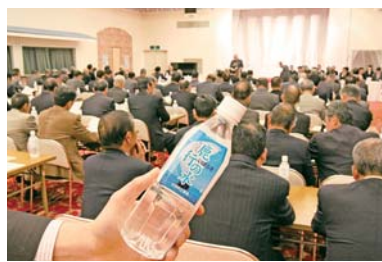
▲市役所で開催される会議やイベント等には「鹿行の水」を提供し、水道利用促進のPR活動を行っています

※『鹿行の水』：県企業局が製造販売しているペットボトル入りの水道水。市では、県企業局の協力により、加入促進PR用として無償提供を受けています。