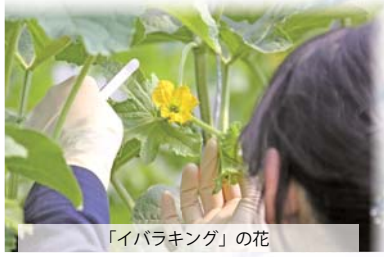
「イバラキング」の花