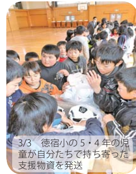
3/3 徳宿小の5・4年の児童が自分たちで持ち寄った支援物資を発送