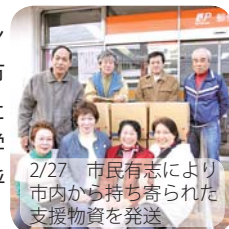
2/27 市民有志により市内から持ち寄られた支援物資を発送

2月から3月にかけてザンビアの孤児院「カシ子子供の家」へ徳宿小、市内3校の高校生、市民有志たちにより、それぞれ文房具などを詰めた支援物資が発送されました。同活動は、杏林大学大学院の堤可厚教授が提唱しみかん箱交流とも呼ばれ、市内での活動は今年7年目を迎えました。