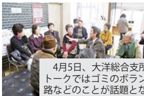
4月5日、大洋総合支所で行われた朝市トークではゴミのボランティア収集や道路などのことが話題となりました。

とき 5/10(月)旭総合支所 6/7(月)銚田市役所 ※時間はいずれも8:15～9:15