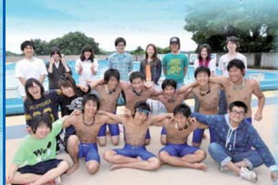
▲公演を終えて(監督・OB・男女水泳部員)