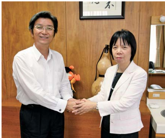
山口やち系氏、59歳。6月、茨城県初の女性副知事に就任。生まれも育ちも鉾田（現在も市内在住）。鉾田二高教諭を経て、知事部局に出向し、高齢福祉課長、秘書課長、保健福祉部長などを歴任