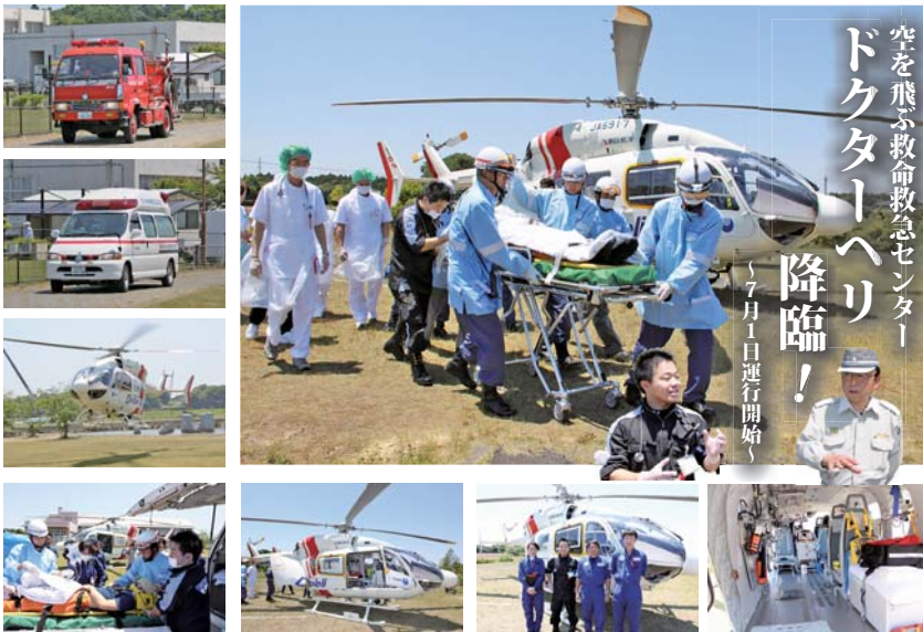
空を飛ぶ救命救急センター「ドクターヘリ」降臨！ 7月1日運行開始

趣味は、読書と家庭菜園。料理が好きで、「天ぷら」はちょっと自信があるとのことでした。