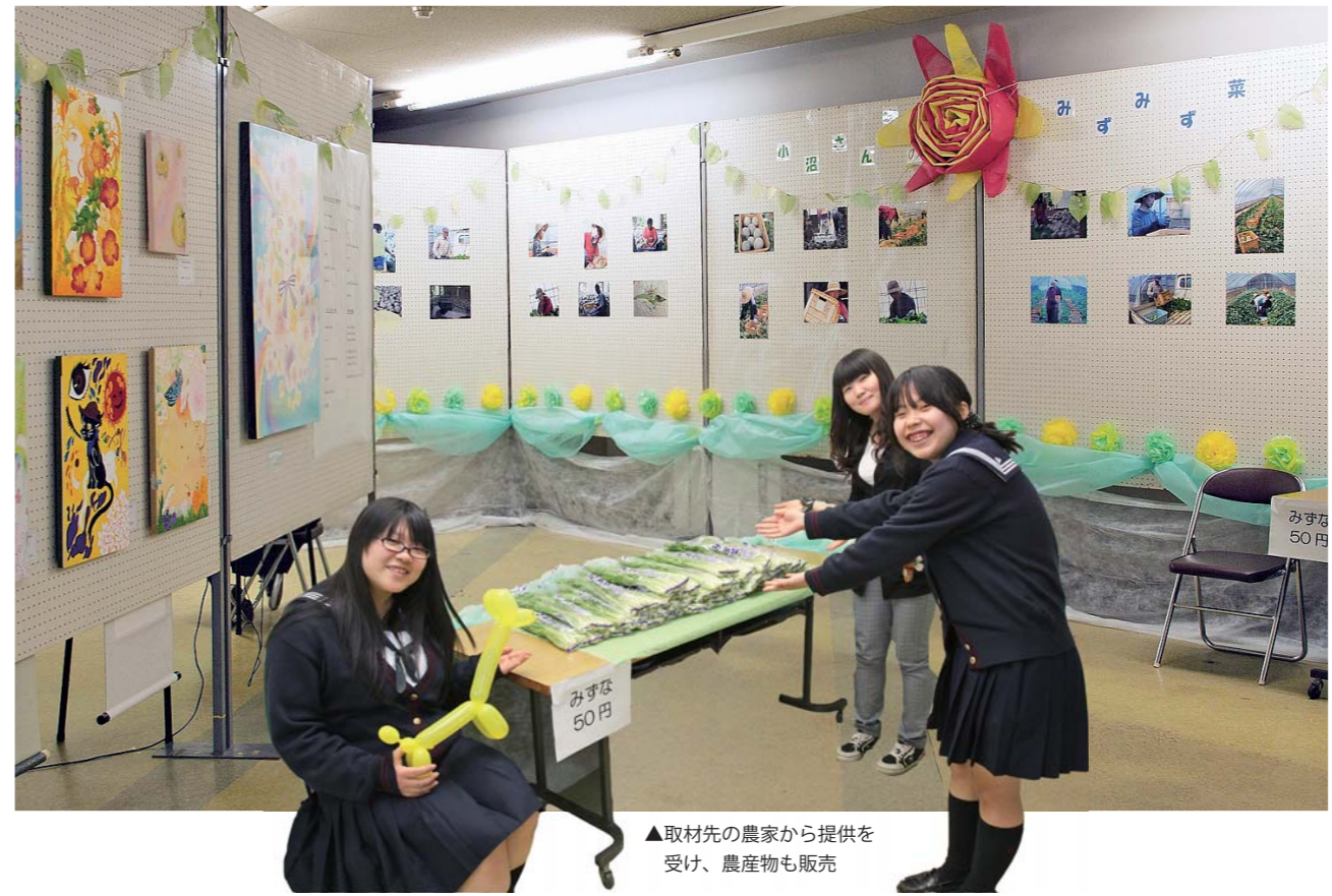
▲取材先の農家から提供を受け、農産物も販売