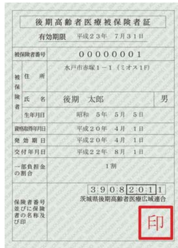
▲新しい被保険者証の色は黄緑色になります。