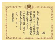
旧陸軍従軍看護婦