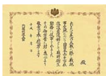
旧日本赤十字社救護看護婦

〒100-8926 東京都千代田区霞が関 2-1-2 総務省大臣官房総務課管理室 業務担当 電話 03-5253-5182 FAX 03-5253-5190