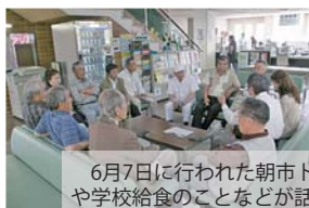
6月7日に行われた朝市トークでは生活保護や学校給食のことが話題となりました。