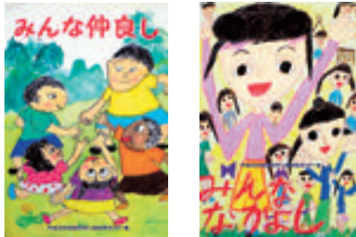
H22年度県優秀賞作品