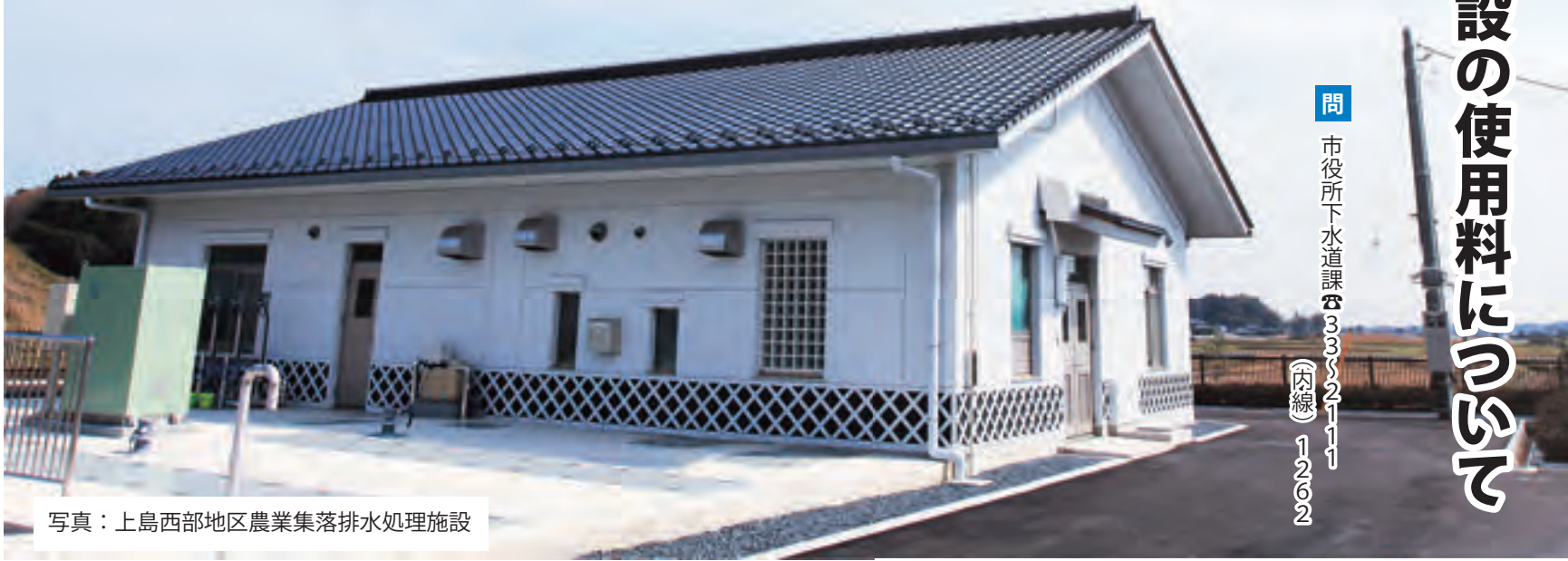
写真：上島西部地区農業集落排水処理施設

なお、排水設備工事は、工事に必要な専門知識と技術を持った有資格者のいる市の指定工事店へご依頼ください。