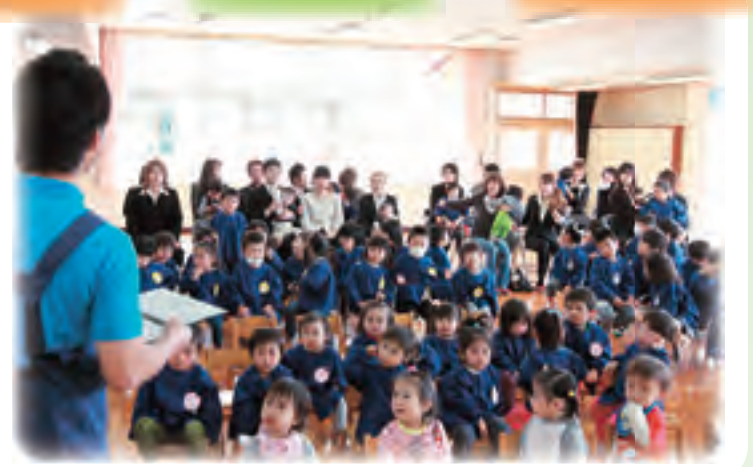
再開の喜びとともに入所式 (第二保育所)