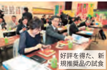
好評を得た、新規推奨品の試食