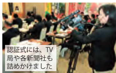
認証式には、TV局や各新聞社も詰めかけました