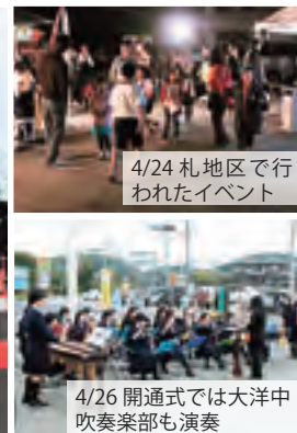
4/24 札地区で行われたイベント