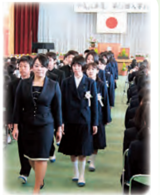
凛々しい制服姿 (銚田南中)