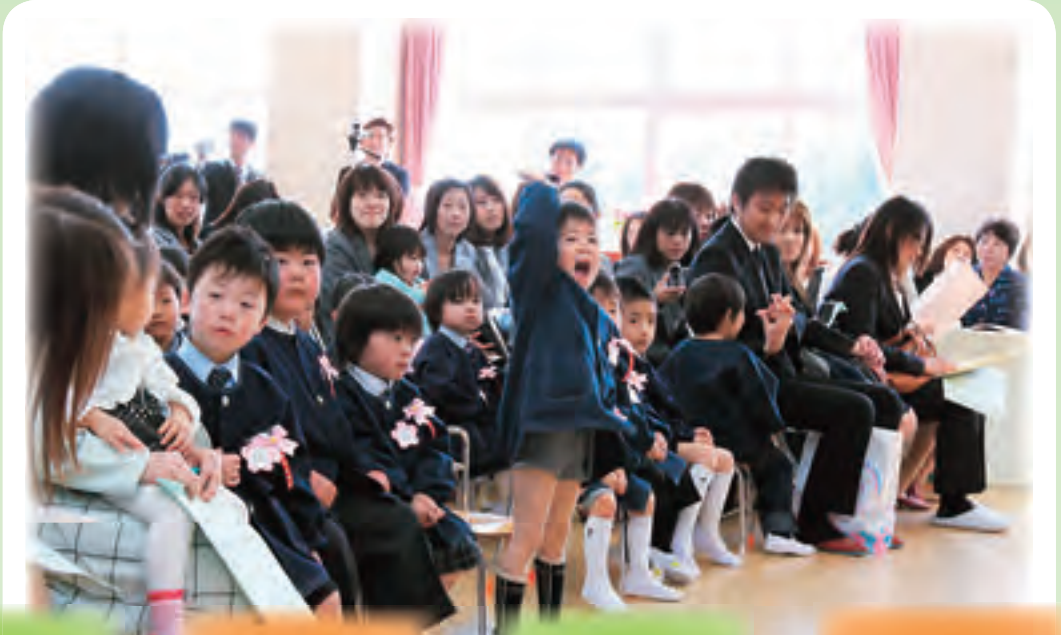
元気よく返事ができました (旭幼稚園)