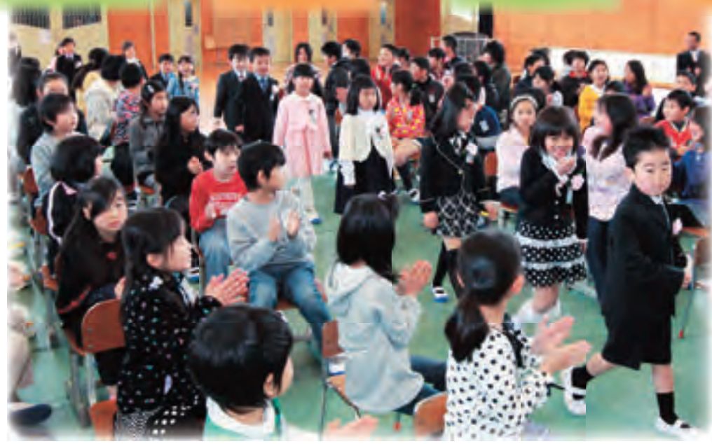
歓迎の拍手で入場 (舟木小)