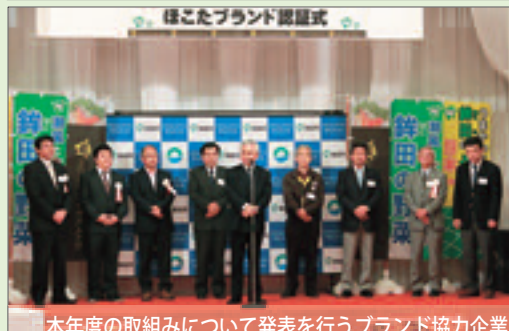
本年度の取組みについて発表を行うブランド協力企業