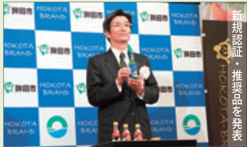
新規認証・推奨品を発表

ほこたブランド認証式では、今年度新たに「ほこたブランド協力事業者」として2事業者へ委嘱状が交付されたほか、「ほこたブランド認証品」として3品目、「ほこたブランド推奨品」として1品目が登録され、新規開発加工品の試食も行われました。