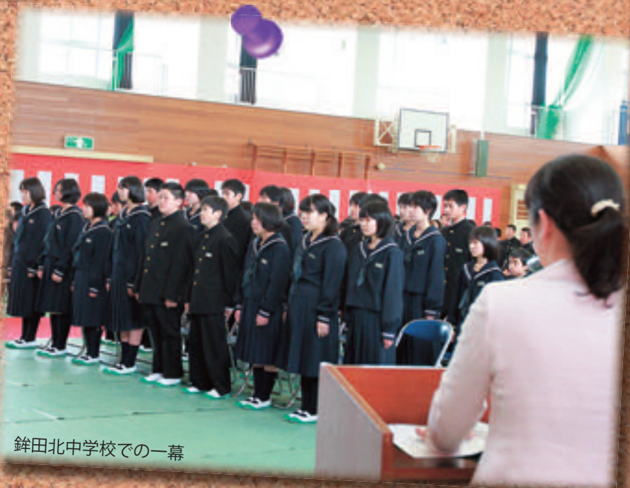
銚田北中学校での一幕