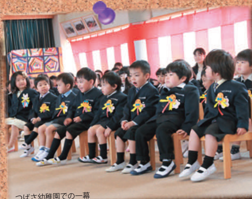
つばさ幼稚園での一幕