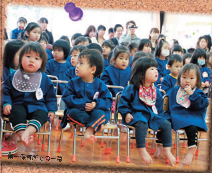
第一保育所での一幕