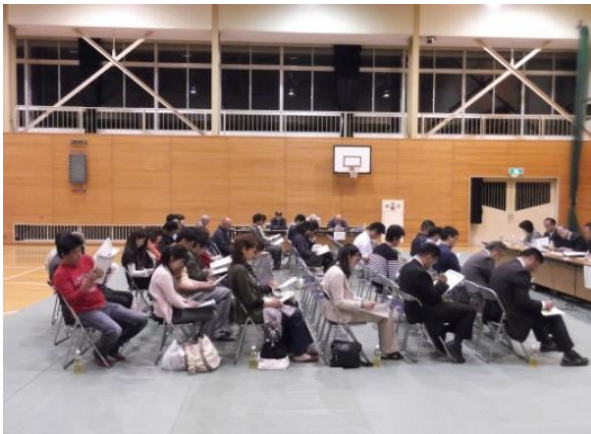
銚田北中学校区地区説明会 (舟木小学校体育館)