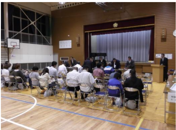
大洋中学校区地区説明会 (白鳥東小学校体育館)