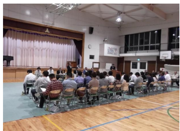
旭中学校区地区説明会 (旭北小学校体育館)