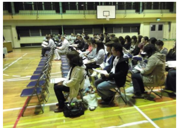
銚田南中学校区地区説明会 (諏訪小学校体育館)