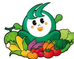
幸せのほこたメロン♪を、ほこまると一緒に踊る