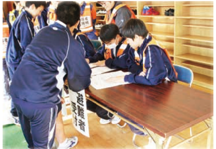
2019 12/12 地域と学校が連携した防災教育事業 避難所開設訓練 THU

コンテストには、同校2年生19名と首都圏の大学生10名が参加しました。高校生と大学生は、混合で4つのチームに分かれて、10月29日、30日の2日間にわたり1チーム3箇所の地元事業者を取材。取材先から得られた、さまざまな情報や事業者の熱い思いを各チーム1つの企画にまとめあげ、コンテスト当日に、地域内で持続的に取り組める企画などを、それぞれのチームの取材先や生徒たちの思いとともに発表しました。