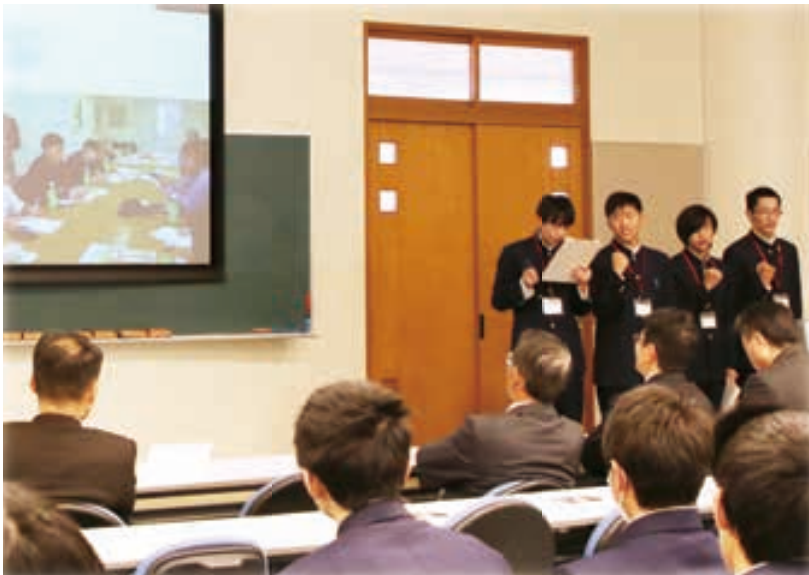
2019 12/11 まちづくりコンテスト WED

学生たちが、市内事業者たちへ取材を行い、課題を含めた銚田市の可能性について、自らで考えた企画を発表する「まちづくりコンテスト」が銚田第二高等学校で開催されました。