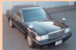
① H6.3月 ② H19.3.27 ③ 70,846km ④ 30,000円