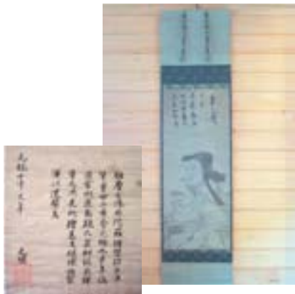
今回は光圀やその関係者による書簡などと合わせて指定されました

このたび、大蔵地区の福泉寺が所蔵する紙本墨画「維摩居士像」(写真左)が県指定文化財に選定されました。(指定日：平成17年11月25日)