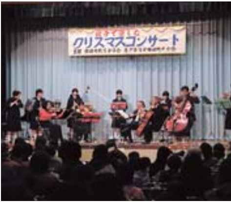
生の音はとても魅力的