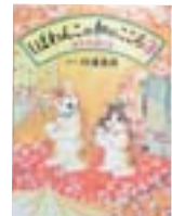
しばわんこの和のころ3 日々のゆしみ