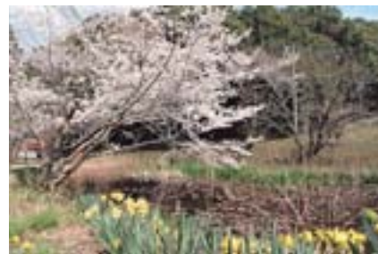
福泉寺は、四季折々の情景が楽しめる名所でもあります