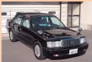
① H8.4月 ② H19.4.18 ③ 107,193km ④ 30,000円