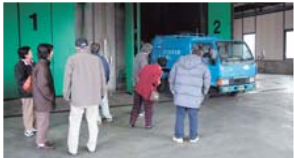
クリーンセンターで

最終日は3月22日、帯刀治茨城大教授による「ムラづくりへ、新たなる旅立ち」というテーマで特別講演があり、塾生は、はれて卒塾となります。