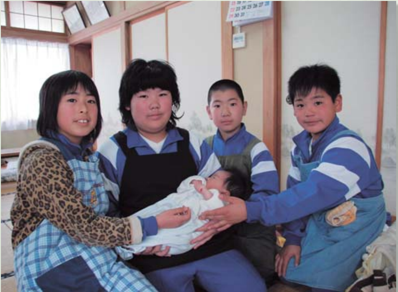
赤ちゃん ふれあい体験学習 —上島西小学校—