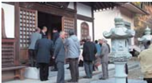
12月15日には、鹿行地区の文化財保護審議委員会が、研修の一環として福泉寺を訪れ、「維摩居士像」を拝見

この画は昭和49年に大洋村の有形文化財に指定されていましたが、県文化財保護審議会に再鑑定を依頼したところその価値が見直されました。