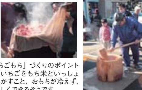
「いちごもち」づくりのポイントは、いちごをもち米といっしょにふかすこと、もちが冷えず、おいしくできそうです

また、いちごフェア恒例の、新春もちつき大会も行なわれ、あんころもちなどが無料サービスされましたが、なかでも、つみたていちごをおもちの中につきこんだ「いちごもち」は、グリーンショップほこたのオリジナル名物。ほんのりいちごの香りがする淡いピンク色のおもちは人気を集めていました。