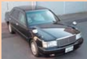
① H11.4月 ② H18.4.19 ③ 176,216km ④ 50,000円