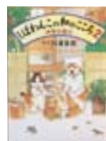
しばわんこの和のころ2 四季の喜び