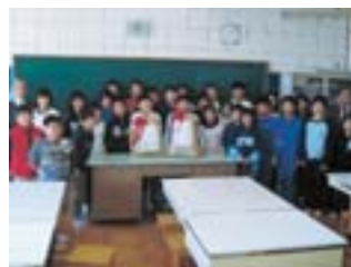
寄付されたもち米は60kg (巴第一小で)