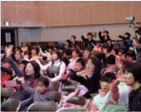
お客さんもアニメソングや「喜びの歌」を合唱。「世界に一つだけの花」は手話で