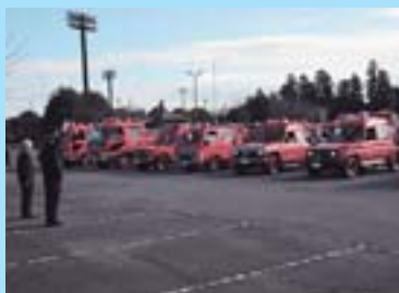
機械器具点検から

1月7日、銚田市消防出初式が行なわれました。式典は旭、銚田、大洋各消防団の地元で開催され、防火活動の充実にむけ新たな決意をあらわしました。式では、茨城県知事表彰をはじめ功労消防団員や優良分団、消防活動協力者への表彰の伝達が行なわれたほか、団員の服装などの検閲が、また屋外では消防車両の点検が実施されました。