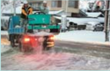
夜明け前から融雪材を散布