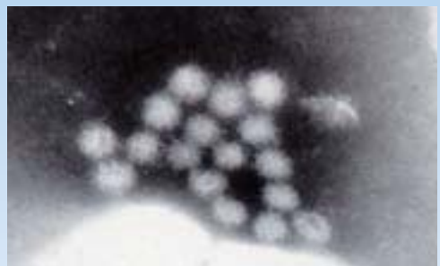
ノロウイルスの電子顕微鏡写真

少量でも発症しやすいなど、ノロウイルスは注意が必要ですが、食品を十分に加熱すれば滅菌することができます。