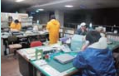
電話の対応におわれるスタッフ