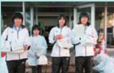
参加者に配られた参加賞のイチゴ