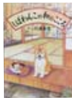
しばわんこの和のころ