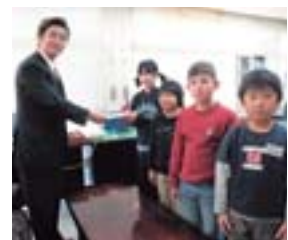
12月16日、当間小から4人が代表で社会福祉協議会を訪れました