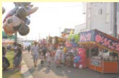
午後から新銚田西地区の道路が歩行者天国となりました

各イベントで盛り上げ 当日は、キャラクターショーや商品券が当たる抽選会などが行われました。