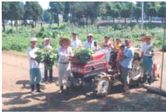
収穫にあたり、利用者の一人が新潟県中越沖地震による被災地への支援を提案。1株10円で義援金を募り、約1万3千円を銚田市社会福祉協議会へ届けました