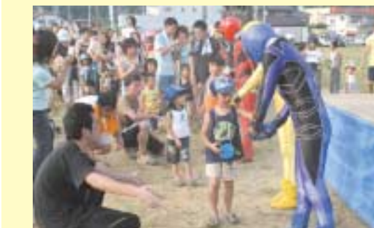
ゲキレンジャーとあくしゅ