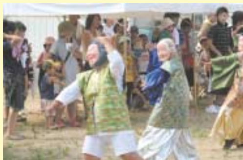
横町囃子連による演舞