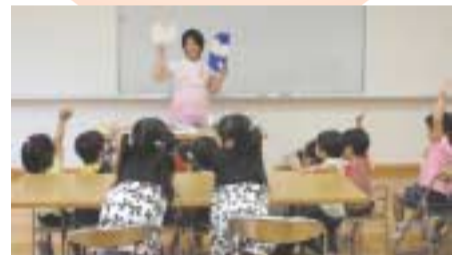
子どもたちも笑顔の大切さを学びました

遊びながら 子育てを 学びましょ う 銚田市女性連絡協議会では、 お子さんの健康管理などに関する アドバイスや、親子で楽しめる 催しを開催しています。 問 銚田市女性連絡協議会 ☎32-2951 大槻 宛