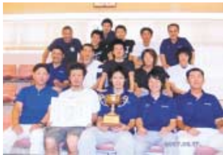
茨城県予選を終えて優勝カップを手に