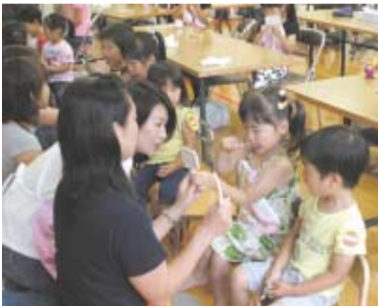
7月の歯みがき教室には親子15組が参加