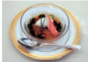
▲銚田市産の食材を使用した料理(「人參、ほうれん草、大根のゼリー寄せ」蟹肉飾り)