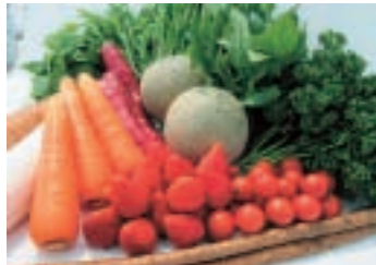
▲農業産出額全国トップクラスを誇る銚田市産農産物