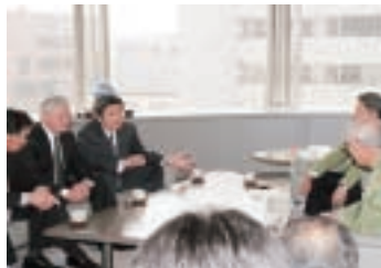
▲日本有数の農産物卸売業者へトップセールス(4/15 東京大田市場にて)