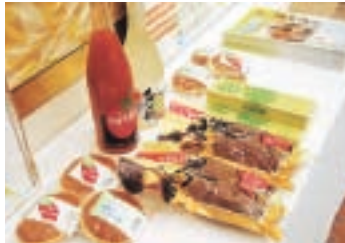
▲銚田市の農産物を使用した加工品