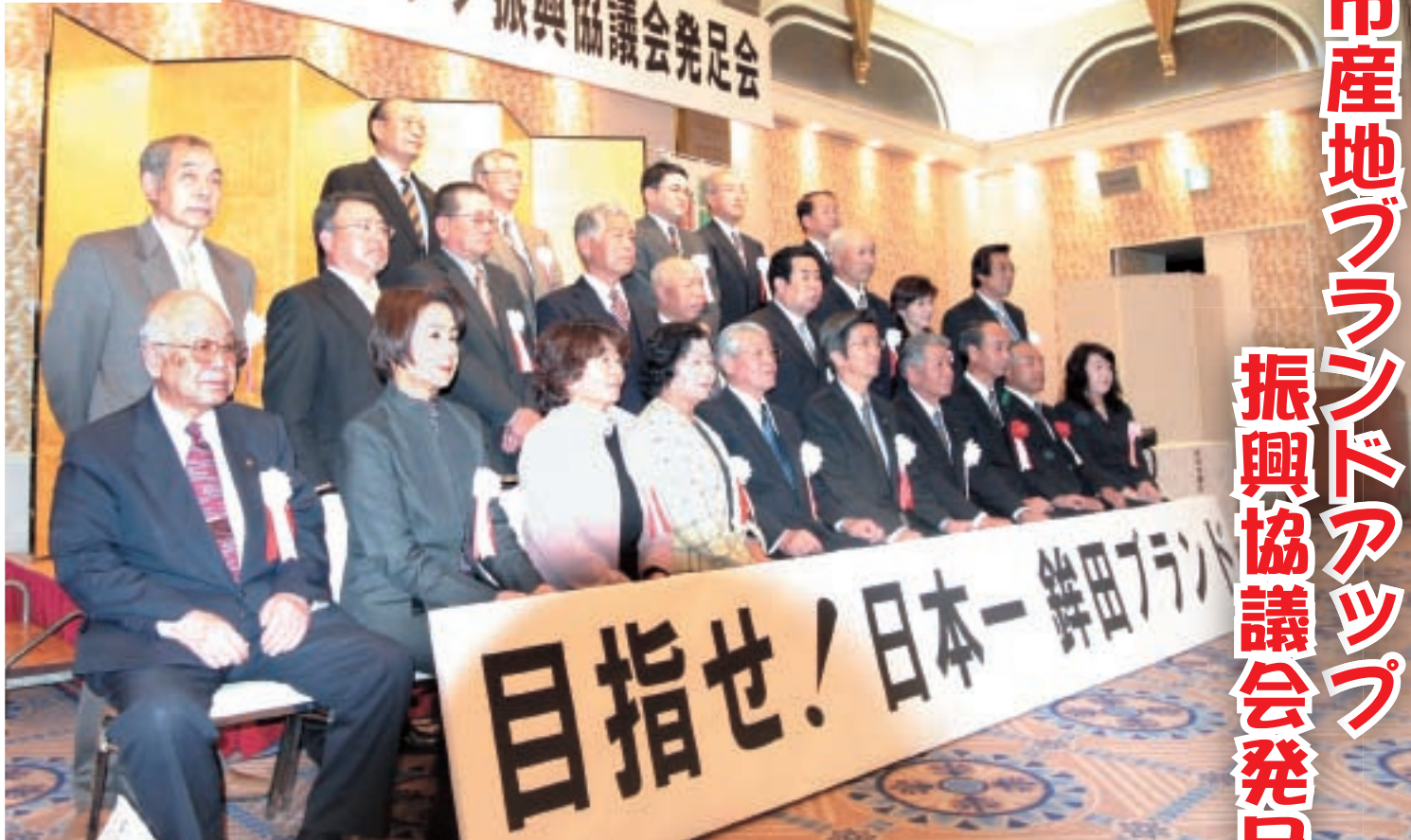
▲銚田市産地ブランドアップ振興協議会の委員