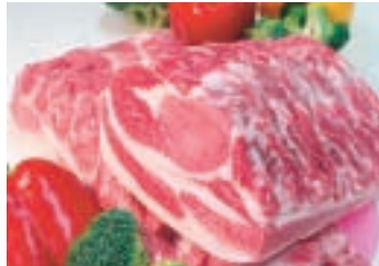
▲農業産出額全国第3位を誇る銚田市産の豚肉