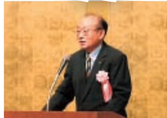
▲あいさつに立ち協議会に全面的支援を表明される亀印製菓(株)社長