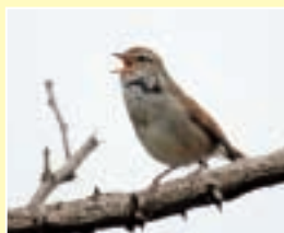
銚田の鳥 ウグイス