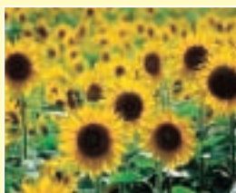
銚田の花 ヒマワリ