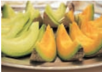
▲初出荷を迎えたばかりの銚田市産メロン