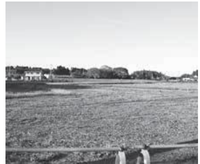
委員会で検討される、白紙撤回となった（仮称）市民交流館の予定地