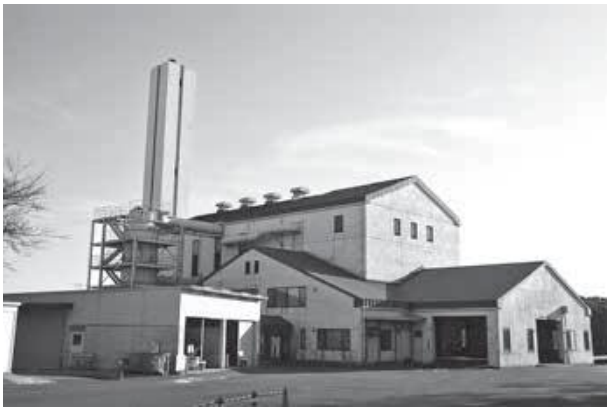
銚田クリーンセンター