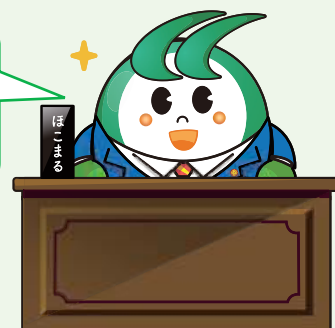
鉾田市マスコットキャラクター ほこまる

決算審査！こんな事業に税金が使われました …… P2～5 ここが聞きたい!! 一般質問 … P11～17 請願審査 “少人数学級の推進や義務教育予算の堅持を求める” …… P18