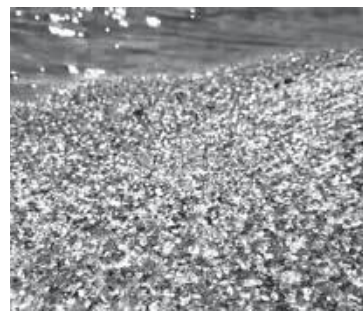
大村市のガラスの海岸

問 本市の観光資源である海を有効に活用する方法の考えは。長崎県大村市の海岸では、廃材のガラス瓶を再利用し、砂の代わりにガラスのかけらを敷き詰め、SNSで話題になっている。このガラスは、角を全て削り落とし、小さな子どもでも安全に遊ぶことができ、粒の大きい再生砂は海中を浄化する働きのあるアサリの幼生が着床しやすいなどの効果もある。