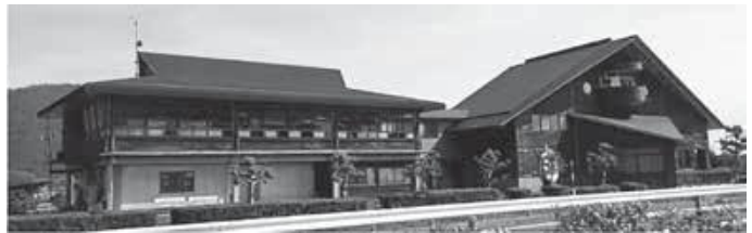
(琵琶湖の水鳥・湿地センター HP より)

水鳥の保護や湿地の賢明な利用を推進するための拠点施設だよ。 銚田市でも涸沼周辺への整備を目指して活動しているよ。