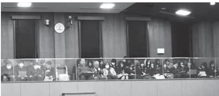
たくさんの傍聴者の中には高校生の姿も!