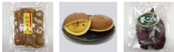
①干し芋 ②どら焼き(さつまいも) ③冷やし焼き芋