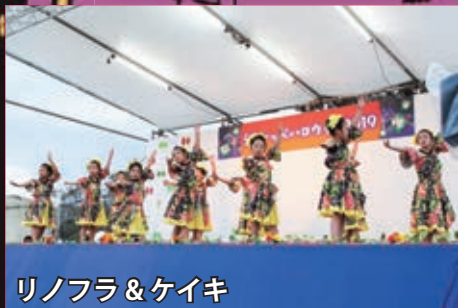
リノフラ & ケイキ