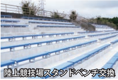
陸上競技場スタンドベンチ交換