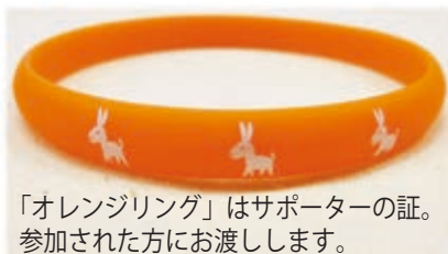
「オレンジリング」はサポーターの証。参加された方にお渡します。