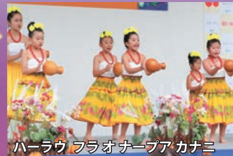
ハーラウ フラオナープア カナニ