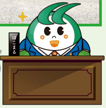
絆田市マスコットキャラクター ほこまる