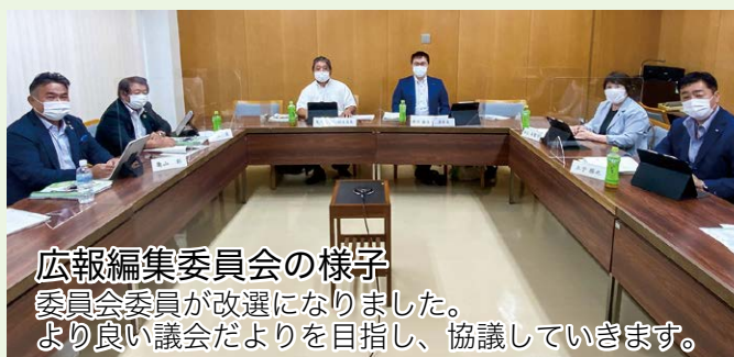
広報編集委員会の様子 委員会委員が改選になりました。 より良い議会だよりを目指し、協議していきます。

令和3年第2回定例会延べ傍聴者数 54 名 議会映像配信視聴数 721 アクセス (令和3年6月4日～令和3年7月4日)