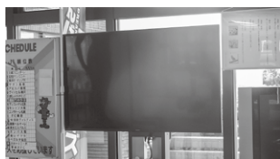
旭総合支所のスクリーン

旭総合支所及び大洋公民館にてスクリーンでの議会中継の視聴が可能になりましたので、ぜひご活用ください。