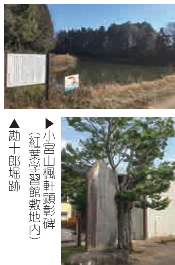
▲小宮山楓軒頭影碑 (紅葉学習館敷地内) ▲勘十郎堀跡

く進まなかった。各地から動員された農民たちには賃金が支払われず、事業の中止を求める一揆に発展してしまつたため、掘削事業は宝永六年に中止となつた。以後、紅葉村や近隣の村々は困窮を極めた。