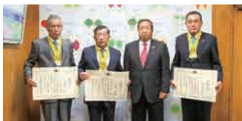
銚田市公式HPでも随時更新しています。

11月22日(月)、鹿島地区保護司会銚田支部の3名の方々が表彰の報告に来てくれました。長年にわたって更生保護活動をはじめ犯罪予防活動等に取り組んできた貢献が認められての表彰であると拝察いたします。法務大臣表彰まことにありがとうございました。