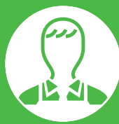
購入者のみなさま