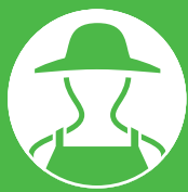
生産者のみなさま