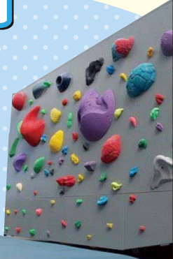
スポーツ クライミング 体験