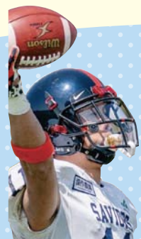
茨城セイバーズ アメリカン フットボール体験