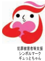
犯罪被害者等支援 シンボルマーク キュッとちゃん

性犯罪被害相談「勇気の電話」【24時間受付】 # 8 1 0 3（シャープハートさん）又は☎ 0 1 2 0 - 2 1 - 8 1 0 3 警察相談専用電話【24時間受付】 ☎ # 9 1 1 0 または☎ 0 2 9 - 3 0 1 - 9 1 1 0 女性専用相談電話【24時間受付】 DV・ストーカー等の相談に女性警察官（女性安心パートナーが対応） ☎ 0 2 9 - 3 0 1 - 8 1 0 7 少年相談コーナー【24時間受付】 ☎ 0 2 9 - 2 3 1 - 0 9 0 0（まるくおさまる）（水戸）