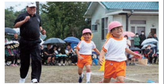
銚田市公式HPでも随時更新しています。

子供たちのあふれる元気と、保護者からの声援に包まれた、温かく楽しい運動会でした。やはり、子供たちの笑顔はいいですね！