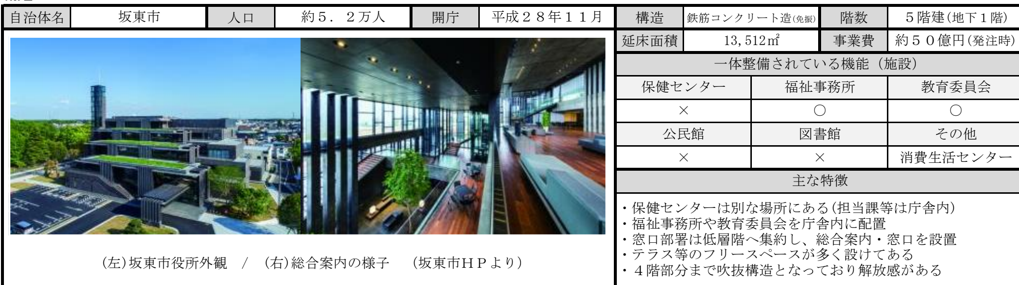
(左)坂東市役所外観 / (右)総合案内の様子