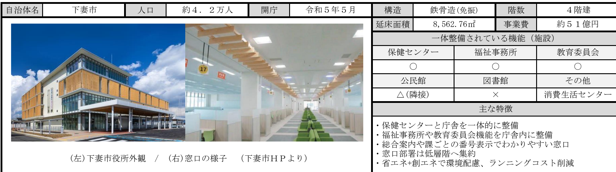
(左)下妻市役所外観 / (右)窓口の様子