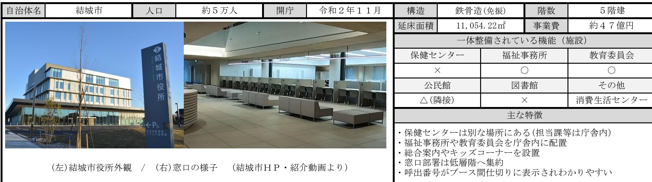
(左)結城市役所外観 / (右)窓口の様子