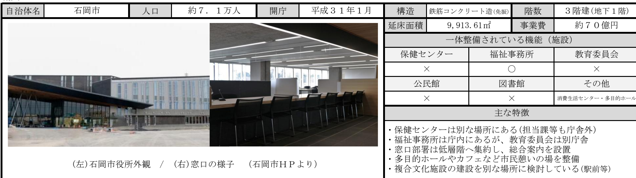
(左)石岡市役所外観 / (右)窓口の様子