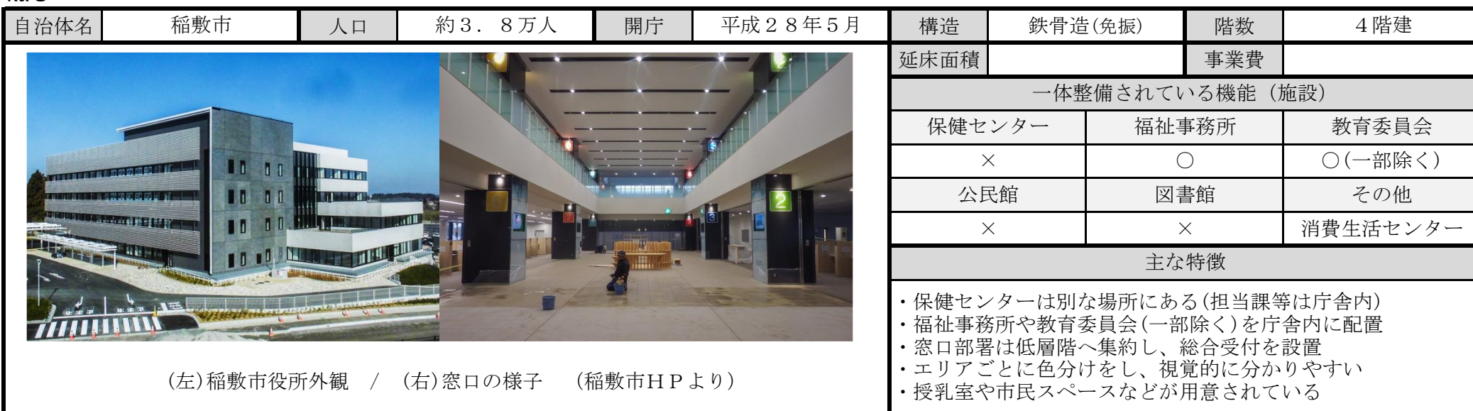
(左)稲敷市役所外観 / (右)窓口の様子 (稲敷市HPより)