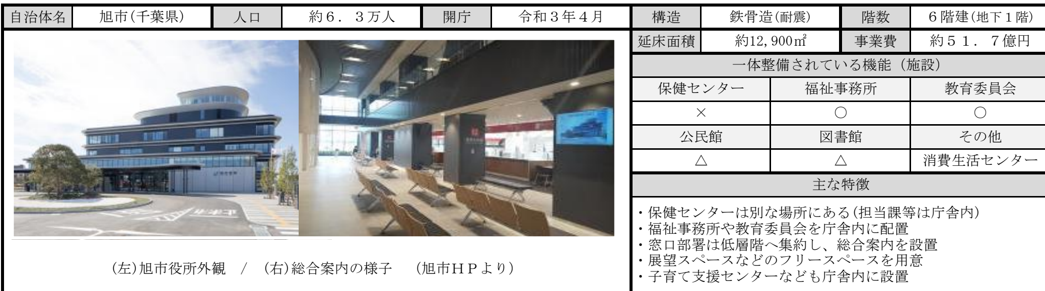
(左)旭市役所外観 / (右)総合案内の様子 (旭市HPより)