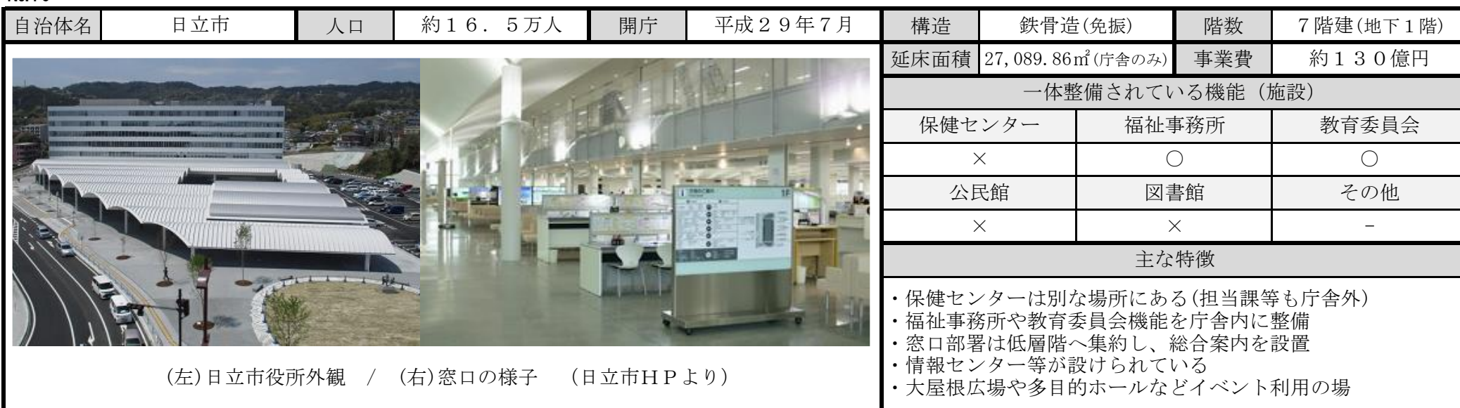
(左)日立市役所外観 / (右)窓口の様子