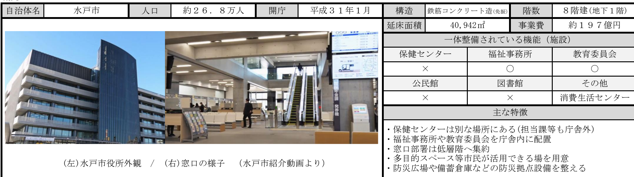
(左)水戸市役所外観 / (右)窓口の様子 (水戸市紹介動画より)