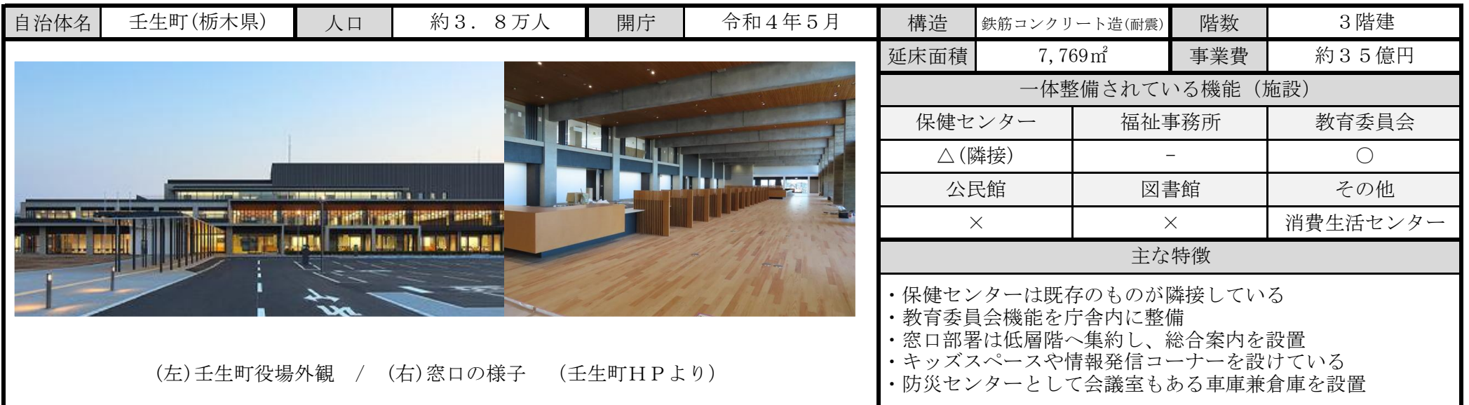
(左)壬生町役場外観 / (右)窓口の様子