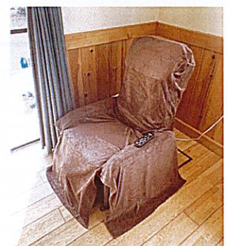
くつろぎゾーン(保護者用) 全身マッサージチェア