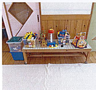
ブロック遊びゾーン