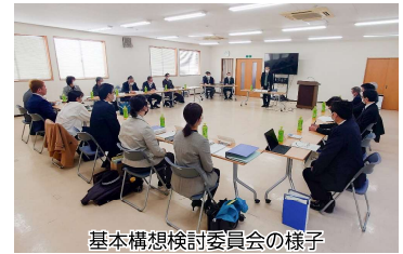
基本構想検討委員会の様子