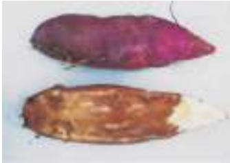
なり首側から塊根腐敗