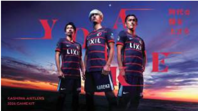
明治安田 J 1 百年構想リーグ新ユニフォームデザインです