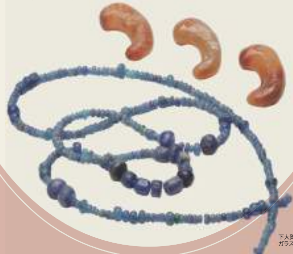
下大賀遺跡出土 ガラス小玉・メノウ製勾玉