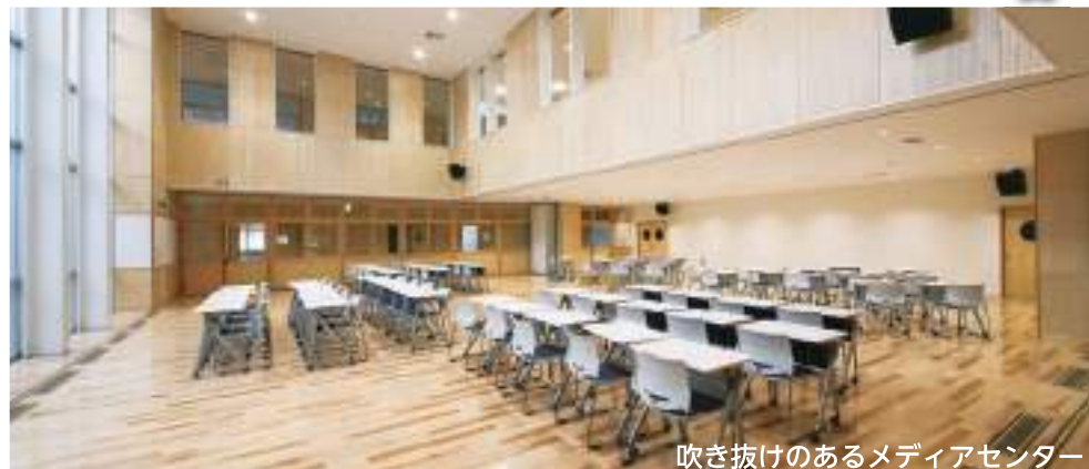
吹き抜けのあるメディアセンター