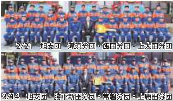
2/21 旭支団 滝浜分団・飯田分団・上太田分団