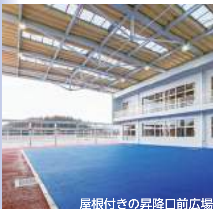
屋根付きの昇降口前広場