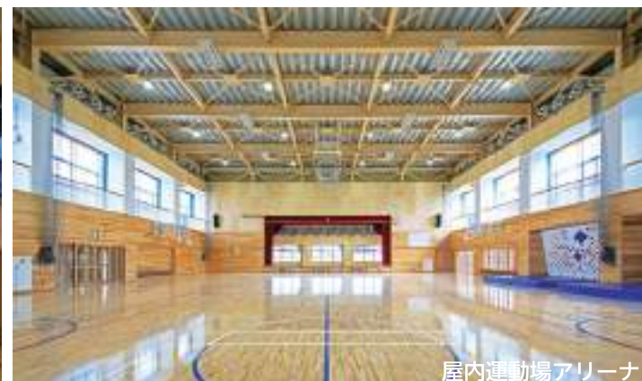
屋内運動場アリーナ