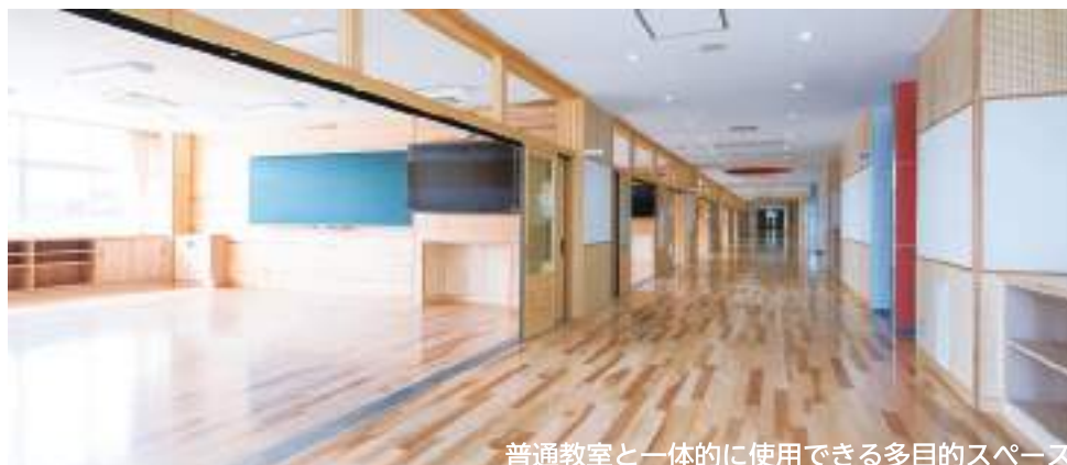
普通教室と一体的に使用できる多目的スペース