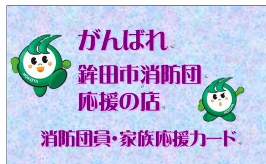
団員がお店に提示するカード