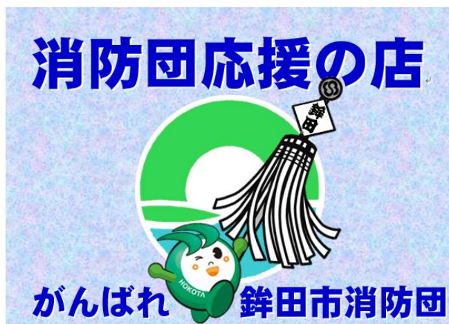
お店に表示する表示証